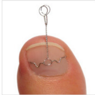
Mit der Schlaufe wird die Spange aktiviert